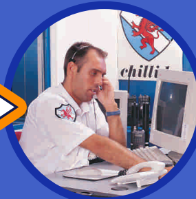
CENTRAL RECEPTORA DE ALARMAS